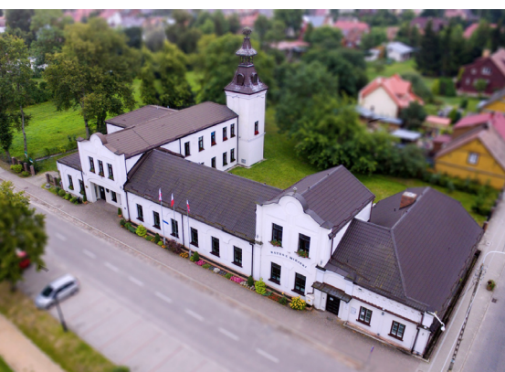
Supraśl – Urząd Gminy