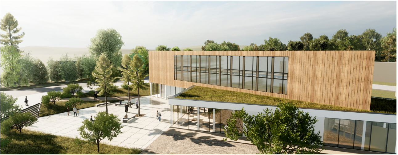
Wizualizacja Centrum Integracji Społecznej w Sobolewie

Pod koniec stycznia 2024 roku gmina Supraśl kupiła działkę w Sobolewie pod budowę Centrum Integracji Społecznej. Jak mówi nam burmistrz, jest to m.in. odpowiedź na postulat mieszkańców, którzy mówili, że nie mają takiego centralnego miejsca dla Grabówki i pobliskich miejscowości, służącego do integracji czy to młodzieży, czy seniorów.